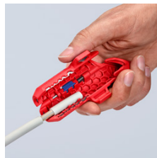
удаление оболочки с провода NYM