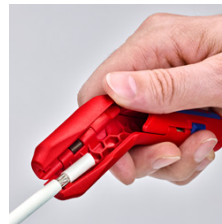
Удаление оболочки с коаксиального кабеля