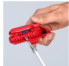
Удаление изоляции с дата-кабеля