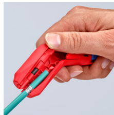
Удаление оболочки с дата-кабеля